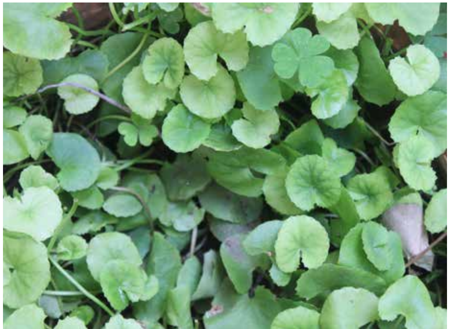
AFBEELDING 1 | Aziatische waternavel ( Centella asiatica ).

ESCOMP geeft enkel CVI en spataderen als indicatie voor inwendig gebruik [3]. De WHO noemt ook stressgeïnduceerde maagdarmzweren als een indicatie die wordt ondersteund door klinische studies. De dosering voor inwendig gebruik van het kruid is 1-2 g/dag. Dat wil zeggen 3 x daags 0,33-0,68 g gedroogd kruid als