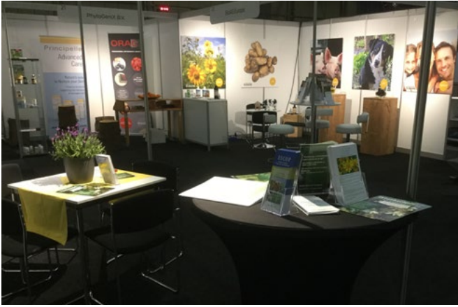
AFBEELDING 1 | NVF-informatie en omringende stands (PhytoGenix en BioAG)