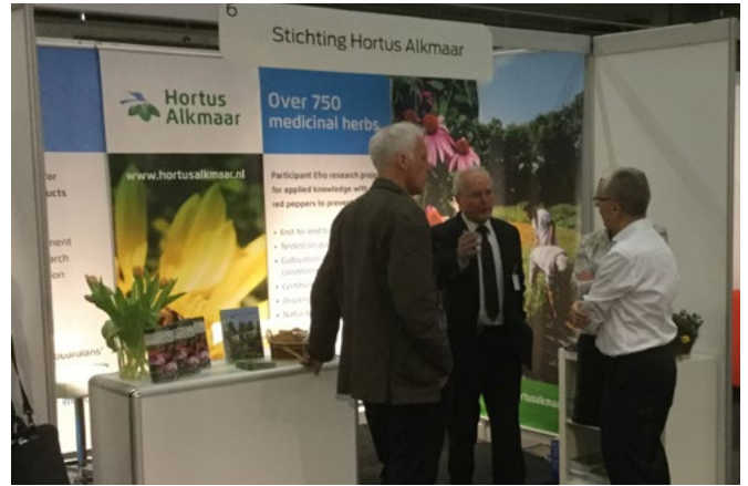
AFBEELDING 2 | Stand Hortus Alkmaar