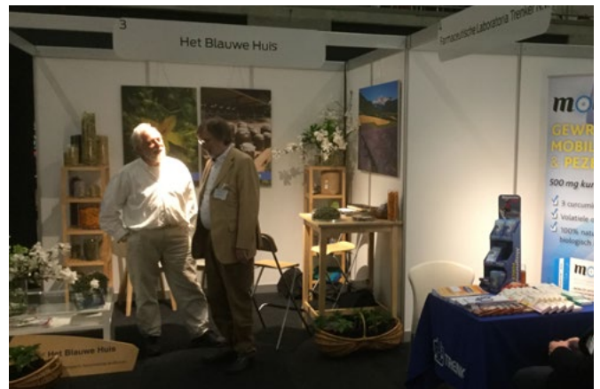
Afbeelding 4 | Stand van Het Blauwe Huis

metaalachtige nasmaak. Dat bij deze stand veel vragen gesteld werden, is niet verwonderlijk.